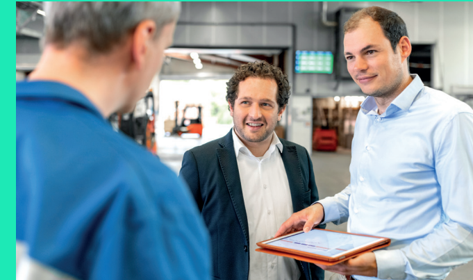
Komfortable Nutzung von phito.maintenance auf mobilen Endgeräten