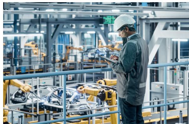
Einfache Anwendung durch verständliche Benutzeroberfläche